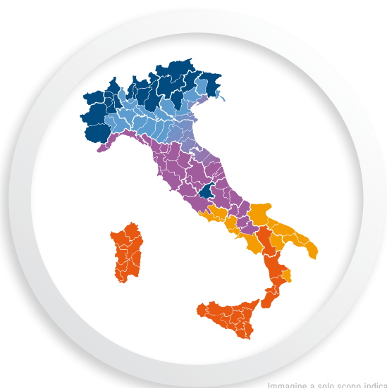
Immagine a solo scopo indicativo.

Il contributo dato dal Conto Termico varia secondo la potenza dell'apparecchio, le sue emissioni e la zona climatica dove è installato. Scopri precisamente in che zona sei: visita il sito www.lanordica-extraflame.com nella sezione dedicata al Conto Termico!